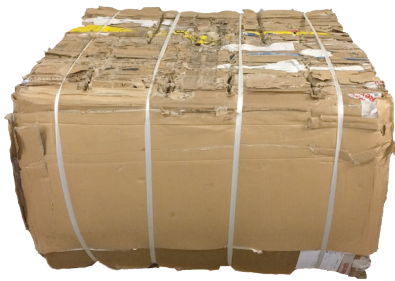
Dichte vermarktungsfähige Ballen

Die Verriegelung mit Spornrad und Riegel an der unteren Tür ermöglicht es dem Bediener, die Tür langsam und vorsichtig zu öffnen, selbst wenn sich expansive Materialien verdichtet werden.